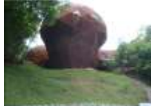
ひょうご環境体験館