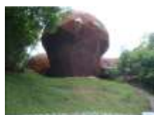
ひょうご環境体験館